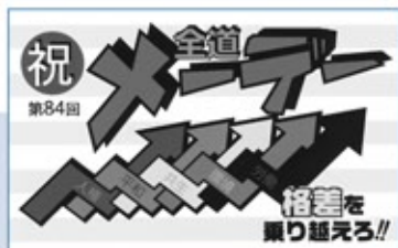
▲昨年度採用の手ぬぐいデザイン