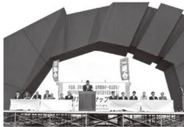
平和ノサップ集会

択捉(えとろふ)島、国後(くなしり)島、色丹(しこたん)島、歯舞(はばまい)群島からなる北方四島は、日本固有の領土です。